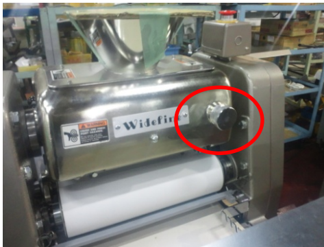
ノブボルトの裏面