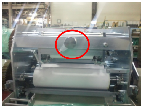
脱落したパーカー鋌